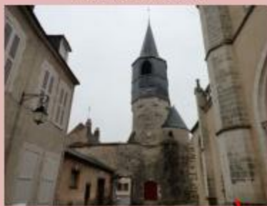
Tour du Clocher