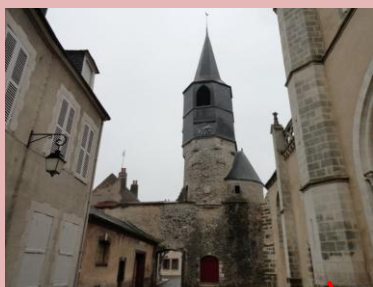
Tour du Clocher